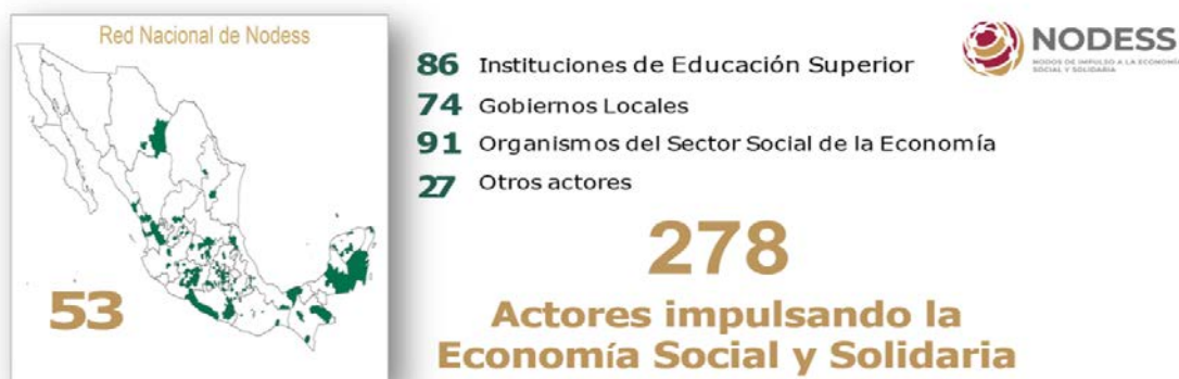
Figura 1. Datos 2021 de la Red Nacional de NODESS

Para incidir en el desarrollo y consolidación organizacional de los OSSE, la Red Nacional de NODESS atiende: